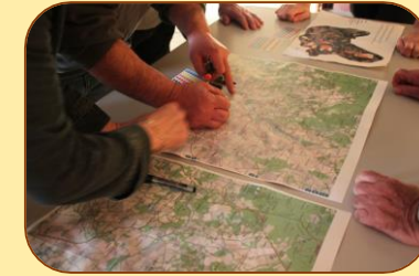
Participants discutant d'une zone d'attention à faire figurer